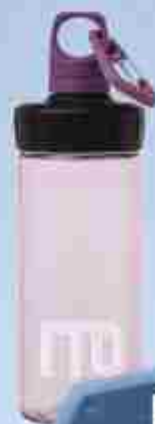
БУТЫЛКА 500 Р