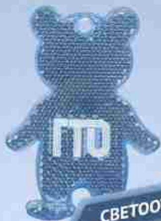
СВЕТООТРАЖАТЕЛЬ 185 Р