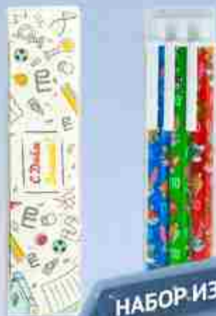
НАБОР ИЗ ТРЁХ РУЧЕК 150 Р