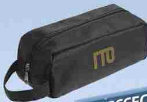
НЕСЕСЕР 400 Р