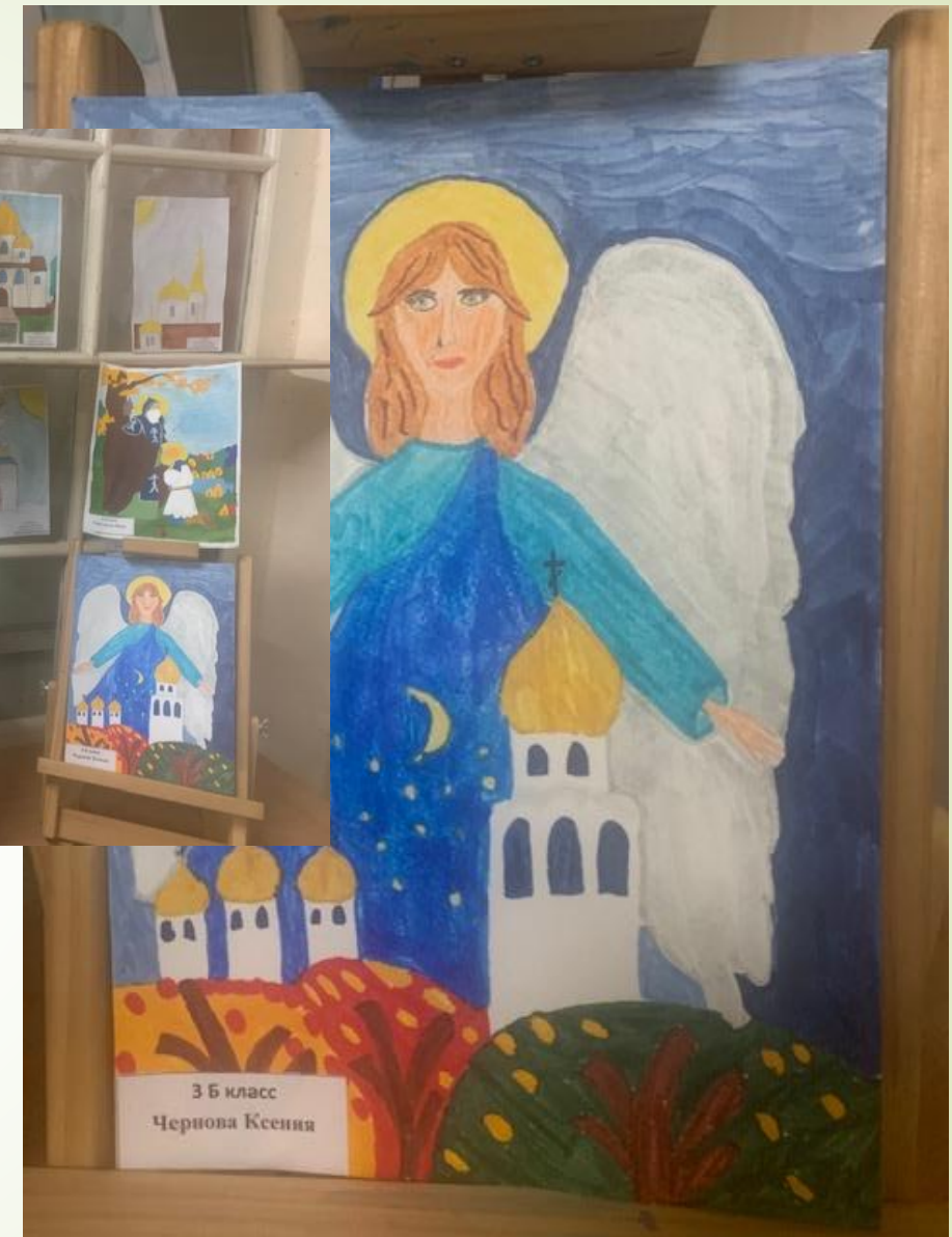
Выставка работ «Чудо Божье»