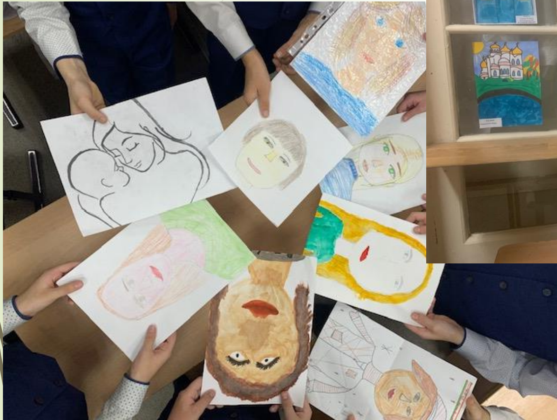
Конкурс рисунков ко дню Мамы