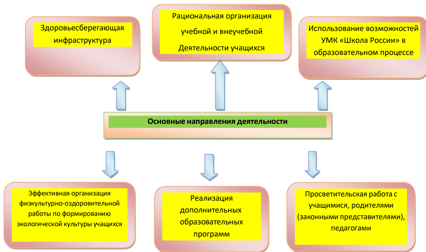
Рис. Основные направления деятельности в рамках ЗОЖ