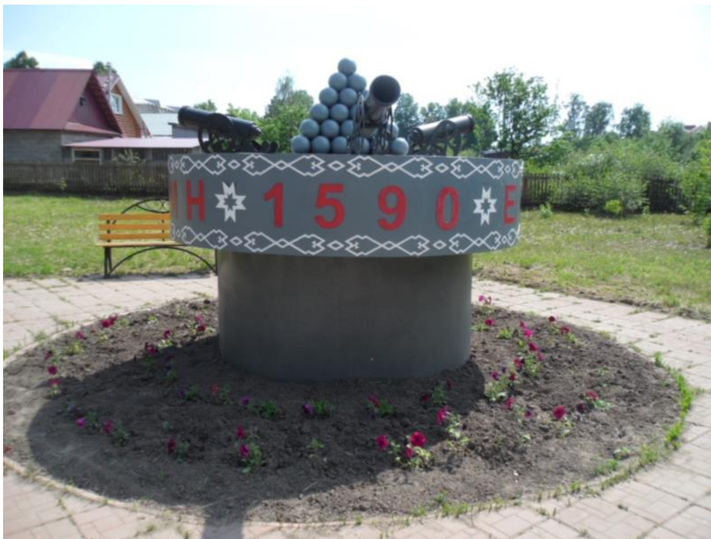
Мемориальный комплекс Ядрин 1590