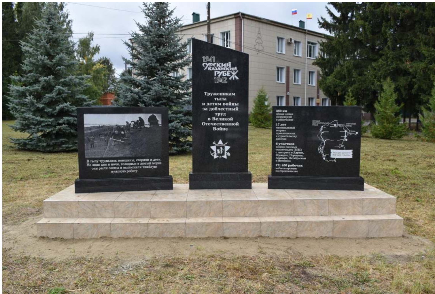
Мемориальный комплекс, посвященный строителям Сурского и Казанского оборонительных рубежей, труженикам тыла, детям и участникам ВОВ 1941-1945