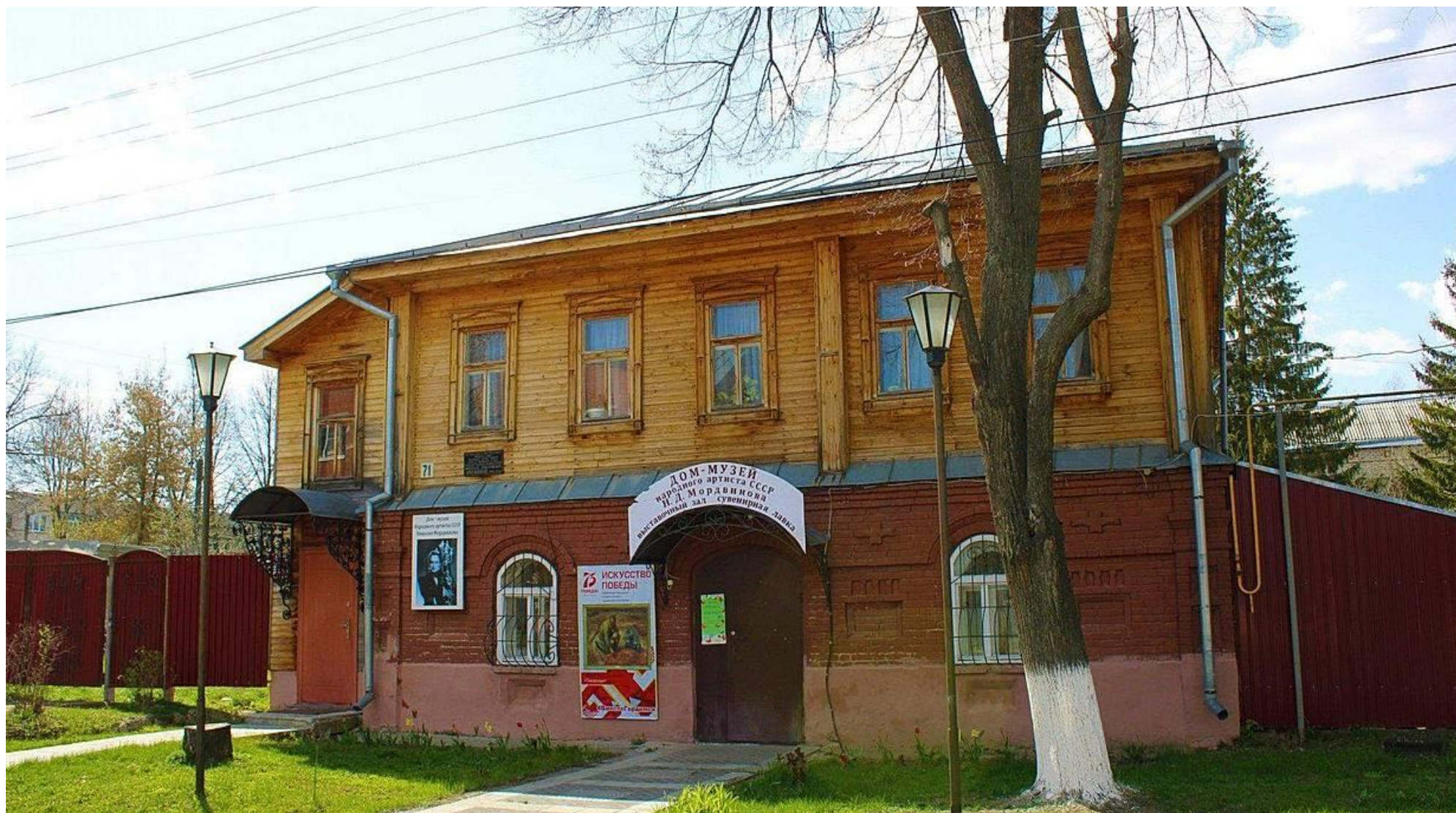
Дом-музей народного артиста СССР Н.Д. Мордвинова