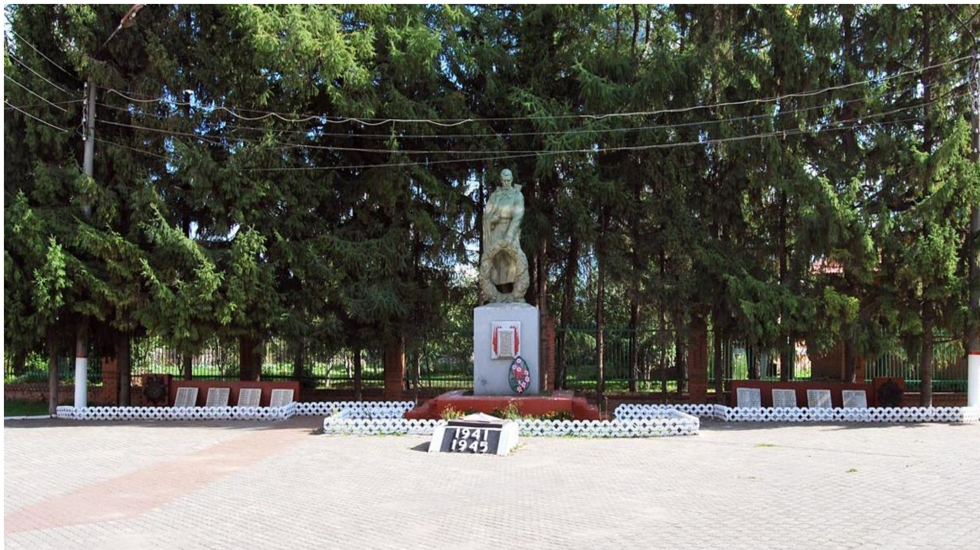
Памятник, мемориал Вечный огонь