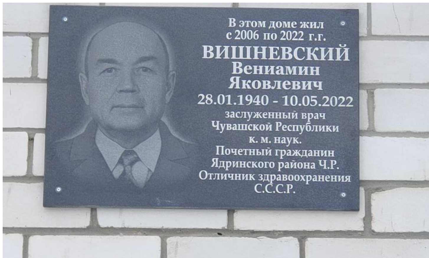
Мемориальная доска педиатру Вениамину Яковлевичу Вишневскому