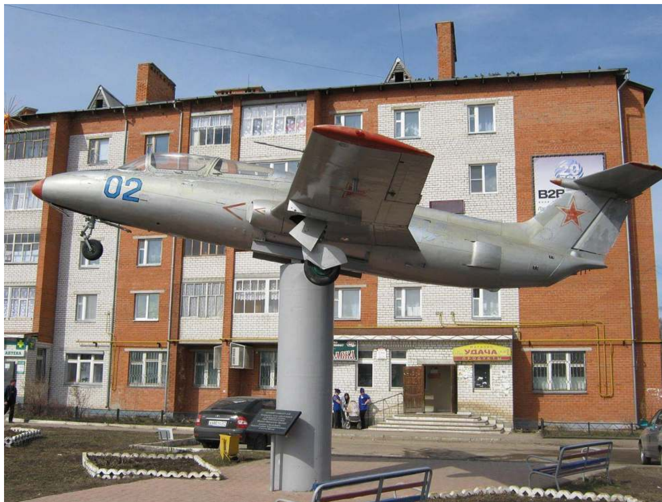
Самолет L -29 на постаменте в честь Героя Советского Союза, лётчика Федота Никитича Орлова.