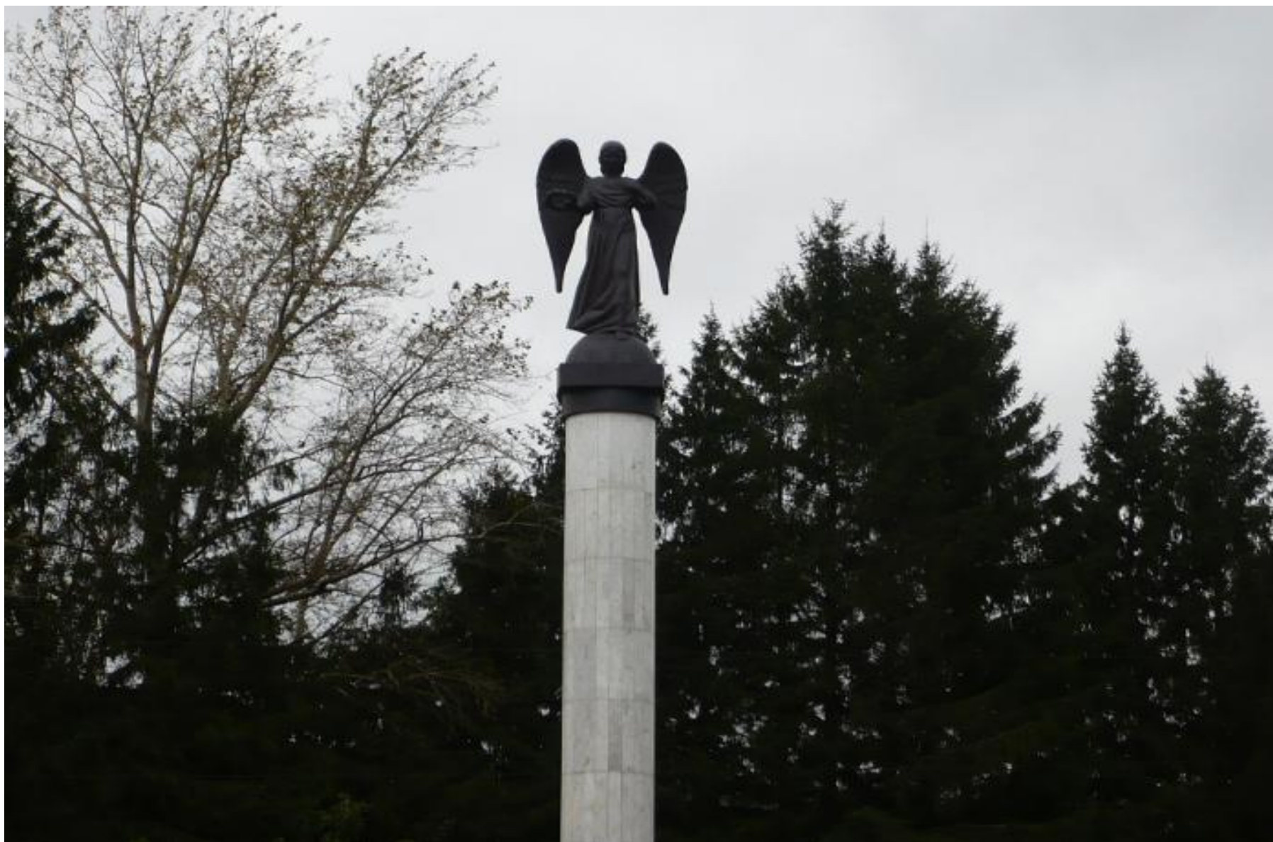
Скульптурная композиция «Ангел памяти и славы»