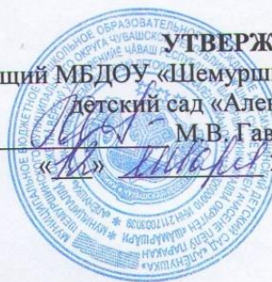
ГРАФИК сменности работников МБДОУ «Шемуршинский детский сад «Аленушка»