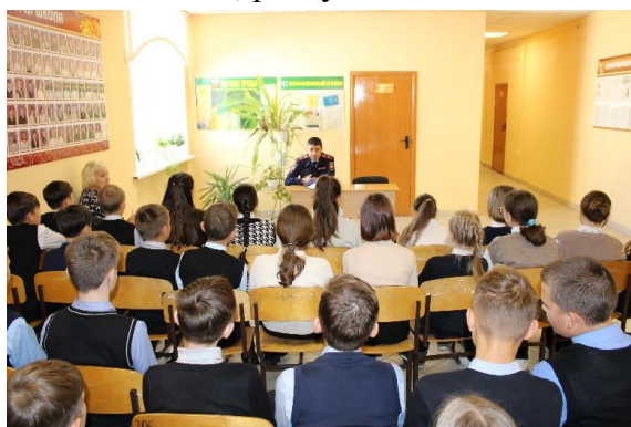
Уровень среднего общего образования