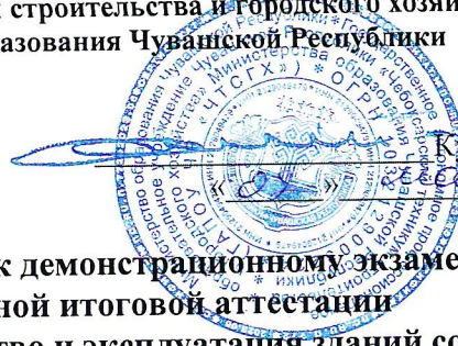
График подготовки студентов к демонстрационному экзамену в качестве государственной итоговой аттестации по специальности 08.02.01 Строительство и эксплуатация зданий сооружений по КОД 08.02.01 – 1--2024 (профильный уровень)