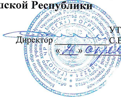
График подготовки студентов к государственной итоговой аттестации в форме демонстрационного экзамена базового уровня по КОД 08.02.07-2-2024

Специальность: 08.02.07 Монтаж и эксплуатация внутренних сантехнических устройств, кондиционирования воздуха и вентиляции