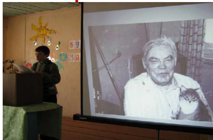
Поисково -исследовательское направление