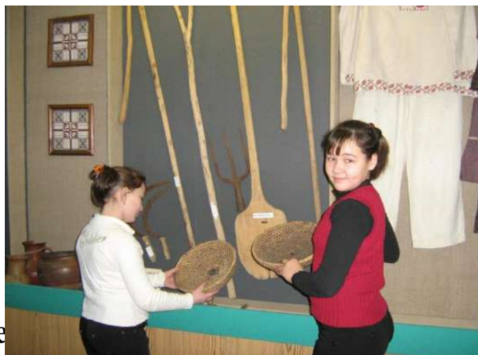
Экспозиционное (оформительское) направление