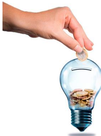
Оплата за свет