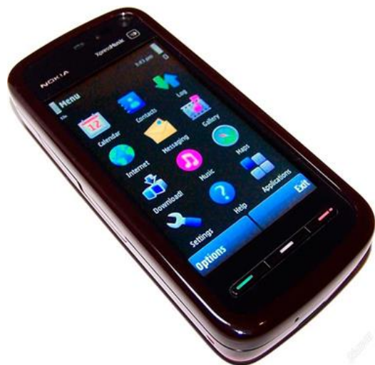
Расходы на мобильную связь