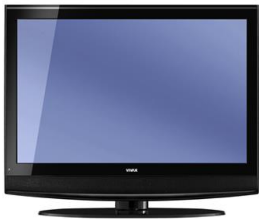
Покупка бытовой техники