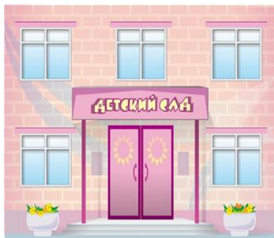
Оплата за детский сад