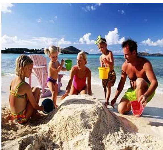
Расходы на отдых