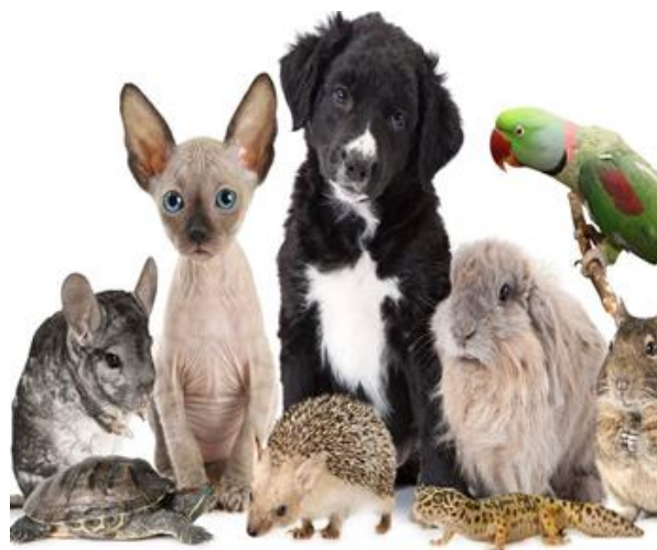
Содержание домашних питомцев