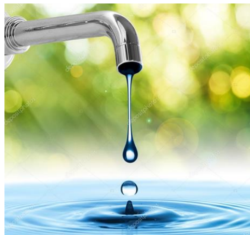
Оплата за воду