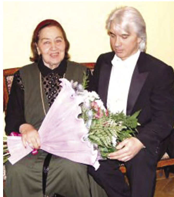
С Дмитрием Хворостовским

Место, которое Ирина Архипова пять десятилетий занимала в искусстве, сравнимо со сверкающей вершиной Олимпа лишь относительно, поскольку вершина эта предполагает заданную недоступность для простых смертных. Творчество же Ирины Архиповой при всей глубине его содержания и ярком многообразии форм отличается – что бы она ни пела, от старинной арии до русской народной песни, – классической ясностью и простотой. Её интерпретации – и оперных партий, и концертных произведений, – порой кажутся единственно возможными, настолько живыми и осязаемыми предстают созданные