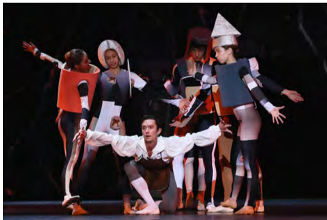
Сцена из спектакля.