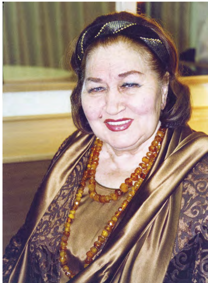
Ирина Константиновна Архипова

Первые месяцы года отмечены знаковыми датами. 2 января 1925 года в этот мир пришла Ирина Константиновна Архипова, 11 февраля 2010 – её земное существование завершилось... Негласный титул «Царицы русской оперы» она носила по праву и с достоинством. Ее имя – одно из самых ярких российских имен на мировой оперной сцене второй половины XX века.