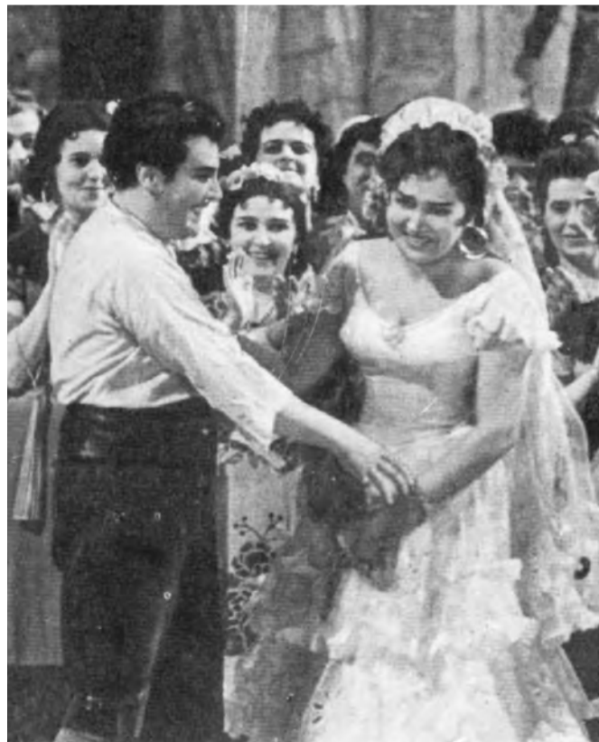
Ирина Архипова и Марио Дель Монако на сцене Большого театра после спектакля «Кармен»

Конкурсы, музыкальные фестивали, концертные программы, осенённые её именем... Беспрецедентная, не имеющая себе аналогов работа на посту президента Международного Союза Музыкальных Деятелей... Интереснейшие начинания Фонда Ирины Архиповой, идеи, которые обретали реальное воплощение... И успехи выпестованных ею певцов – единственное, о чём она мола рассказывать практически бесконечно.