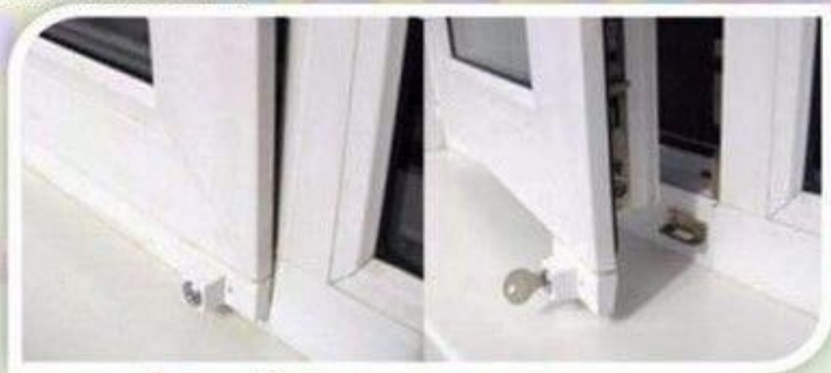
Замок блокировщик с ключом

Можно воспользоваться специальными замками блокираторами, которые предлагают установщики пластиковых окон.