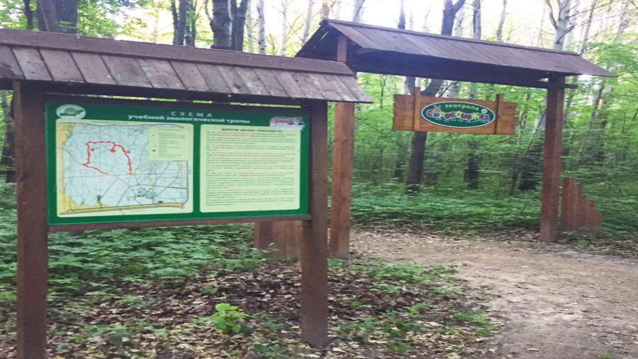
СХЕМА учебной экологической тропы