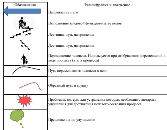
Условные обозначения, используемые при построении карт текущего и целевого состояния процесса