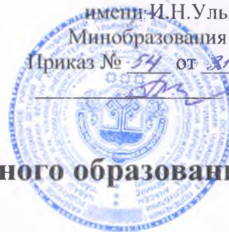
График работы педагогов дополнительного образования