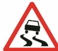
1.15 «Скользкая дорога»

Эти знаки устанавливаются вблизи железнодорожных переездов. Они служат прежде всего для регулирования движения транспорта. Однако пешеходам в целях безопасности тоже нужно дождаться, пока поезд проедет и шлагбаум откроется. Остановить мчащийся на полной скорости поезд ещё труднее, чем автомобиль, по-этому на переезде нужно быть вдвойне внимательными, и уж тем более не играть вблизи железной дороги!