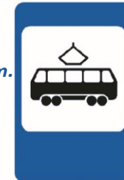
5.17 «Место остановки трамвая»

На посадочных площадках Терпеливо транспорт ждут. Установленный порядок Нарушать нельзя тут.