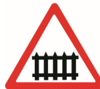
1.1 «Железнодорожный переезд со шлагбаумом»

водителя. Он предупреждает, что впереди – через 50-300 метров будет пешеходный переход и надо снизить скорость.