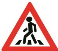
1.22 «Пешеходный переход»

Он предупреждает водителя, что поблизости находится детское учреждение или игровая площадка. И на проезжую часть могут неожиданно выбежать дети. Но этот знак не обозначает место для перехода!