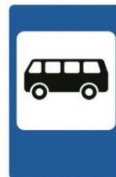
5.16 «Место остановки автобуса и (или) троллейбуса»

На посадочных площадках Терпеливо транспорт ждут. Установленный порядок Нарушать нельзя тут.