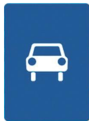
5.3 «Дорога для автомобилей»

Эти знаки устанавливаются на оживленных скоростных магистралях. На них запрещено движение пешеходов вне тротуаров. На автомагистралях и дорогах для автомобилей запрещено движение велосипедов и мопедов. Переходить дорогу, обозначенную знаками 5.1 и 5.3, можно только по подземному и надземному пешеходным переходам.