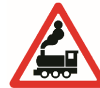
1.2 «Железнодорожный переезд без шлагбаума»

Эти знаки устанавливаются вблизи железнодорожных переездов. Они служат прежде всего для регулирования движения транспорта. Однако пешеходам в целях безопасности тоже нужно дождаться, пока поезд проедет и шлагбаум откроется. Остановить мчащийся на полной скорости поезд ещё труднее, чем автомобиль, по-этому на переезде нужно быть вдвойне внимательными, и уж тем более не играть вблизи железной дороги!