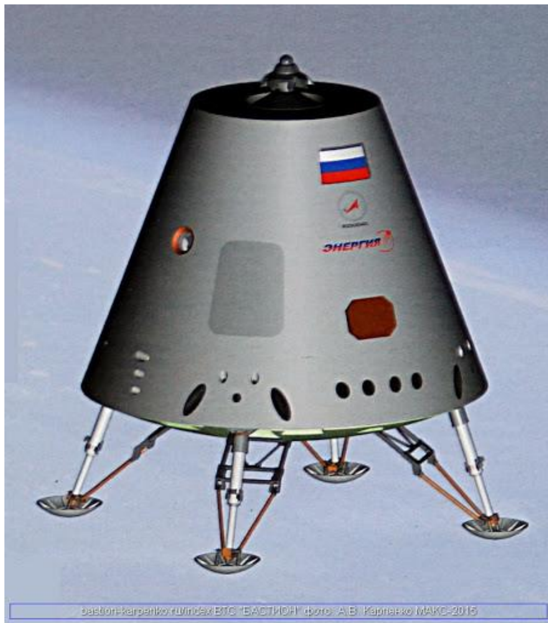
МАКС-2015