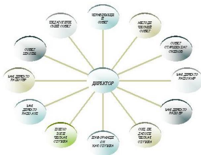
Схема структуры управления Учреждением

По итогам 2020 года система управления Учреждением оценивается как эффективная, позволяющая учесть мнение работников и всех участников образовательных отношений. В следующем году изменение системы управления не планируется.