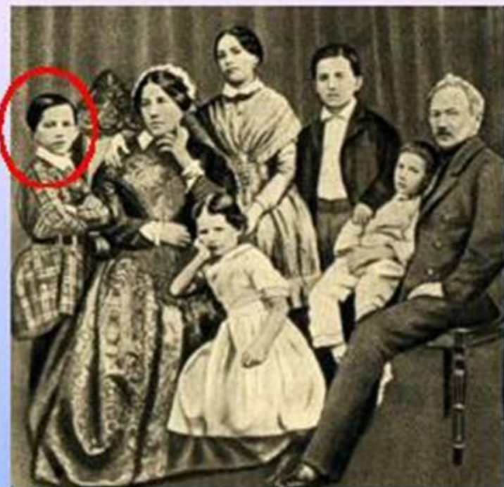
Семья Чайковских в 1848 году (крайний слева — Пётр Ильич)

Родился 25 апреля 1840 года в селении при Камско - Воткинском заводе Вятской губернии (ныне город Воткинск, Удмуртия). Пётр был вторым ребёнком в семье.