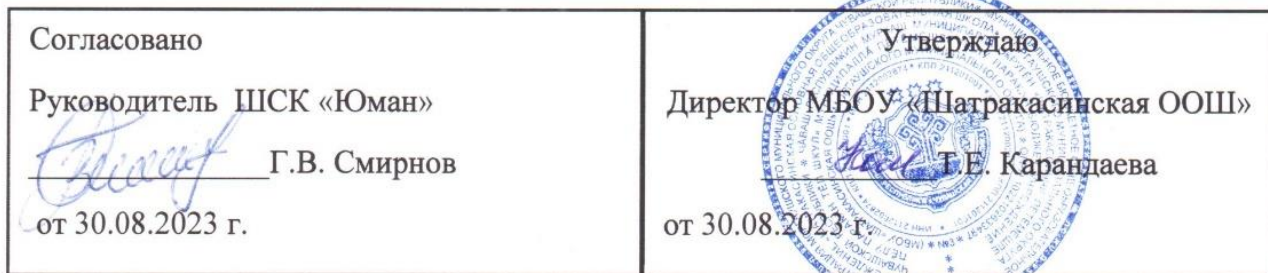
График работы спортивного клуба «Юман» на 2023-2024 учебный год