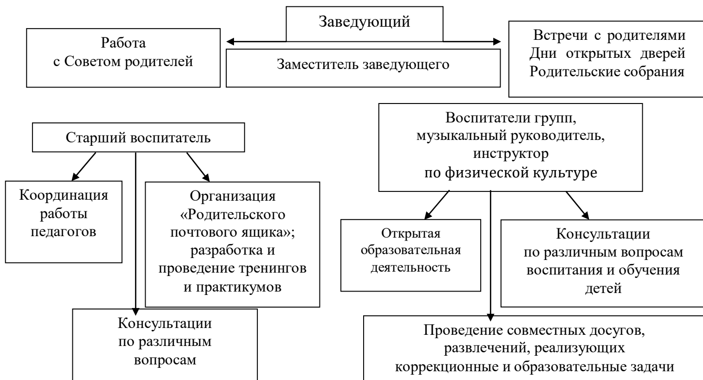
Рис. 1 «Схема взаимодействия с семьями воспитанников»