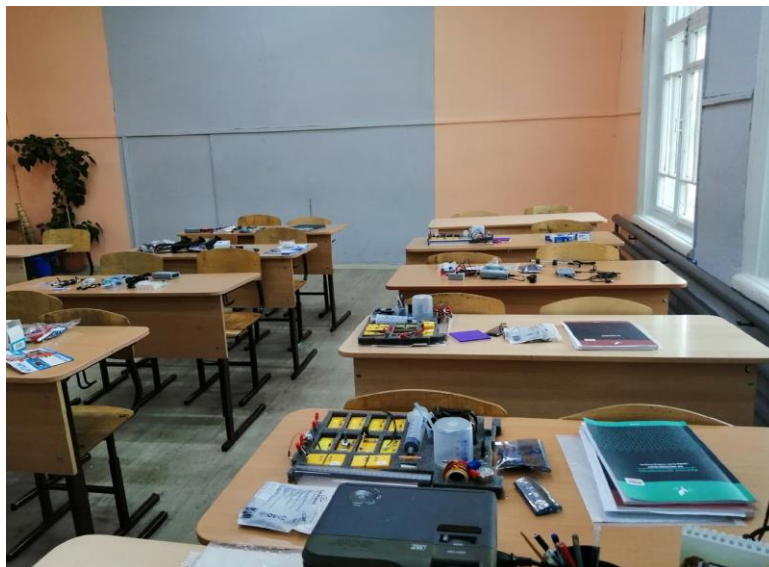
лаборатория по физике