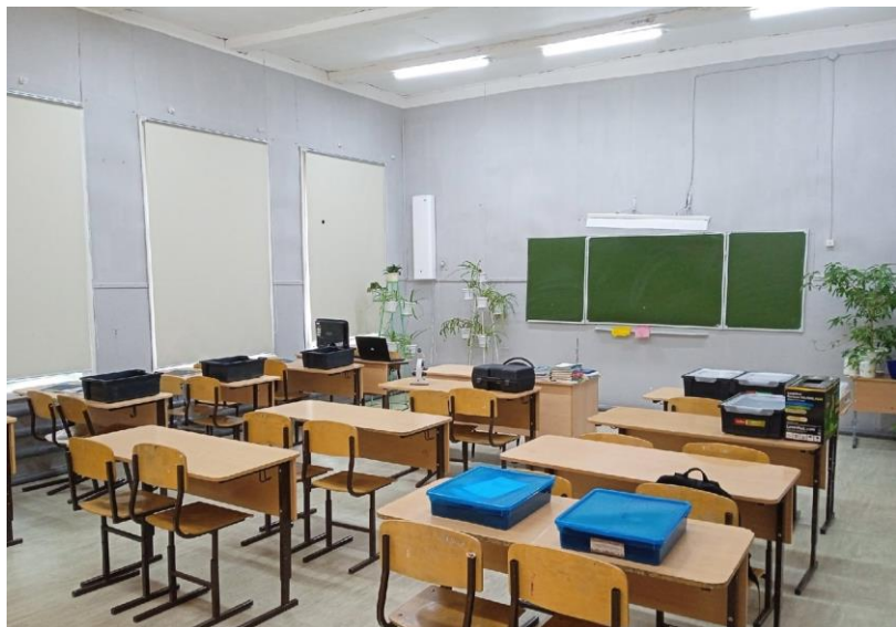
лаборатория по биологии

Для реализации проекта были оборудованы два кабинета, на базе которых работают три лаборатории: