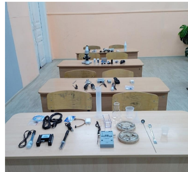
лаборатория по химии