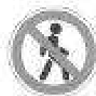
Движение пешеходов запрещено

Используй ВНИМАТЕЛЬНОСТЬ, чтобы быть замеченным на дороге