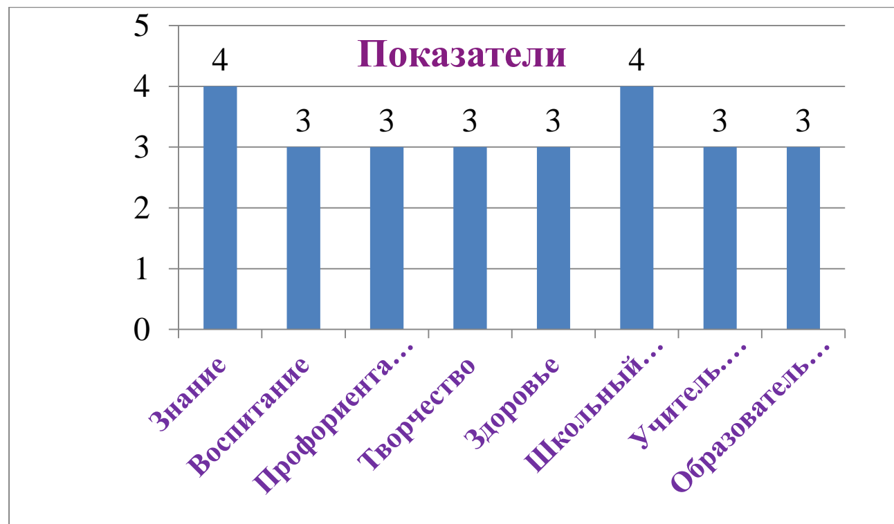
Результаты анализа показателей деятельности организации

Результаты самообследования МБОУ «СОШ №17» г. Новочебоксарск. Школа соответствует критериям и показателям модели «Школы Минпросвещения России на среднем уровне» https://testpoll.ixora.ru/loginForTest Платформа оценки качества образования «Иксора»