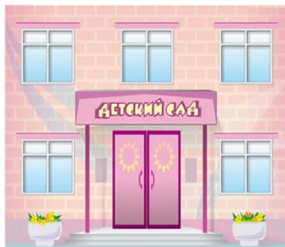
Оплата за детский сад