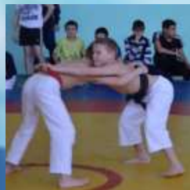
Чувашская национальная борьба на поясах «КЕРESHУ»