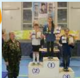
С а м б о