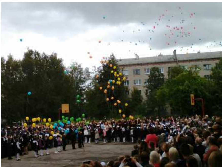
Торжественная линейка, посвященная Дню знаний.

В конце классного часа, дети написали желания на листочках и повесили на волшебное «Дерево знаний», чтобы они скорее исполнилось!