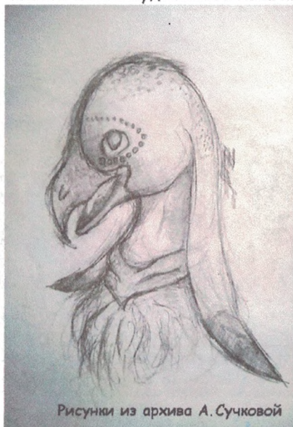
Рисунки из архива А. Сучковой