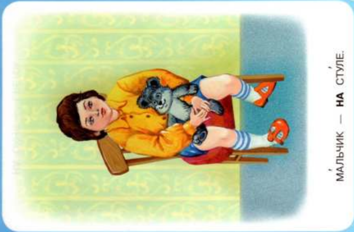
МАЛЬЧИК — НА СТУЛЕ.