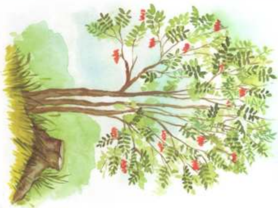
СПРАВА ОТ РЯБИНЫ — ПЕНЁК.