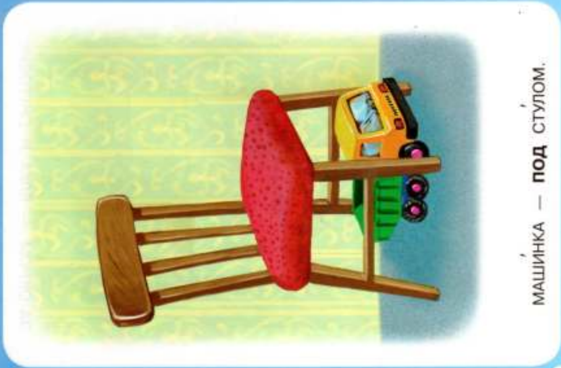
МАШИНКА — ПОД СТУЛОМ.