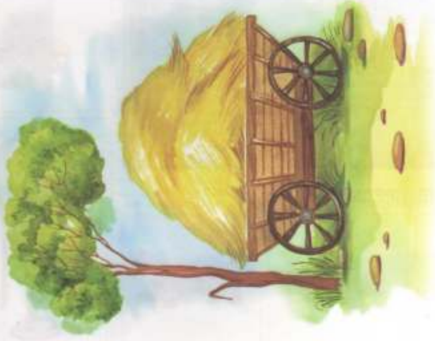
НА ТЕЛЕГЕ — СЕНО.