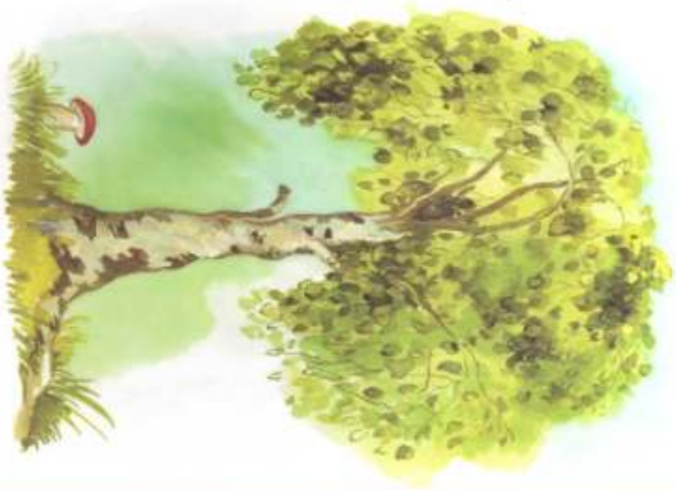
СЛЕВА ОТ БЕРЁЗЫ — ГРИБ.