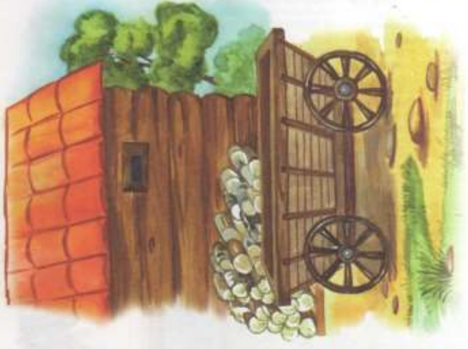
ПОЗАДИ ТЕЛЕГИ (ЗА ТЕЛЕГОЙ) — ДРОВА.