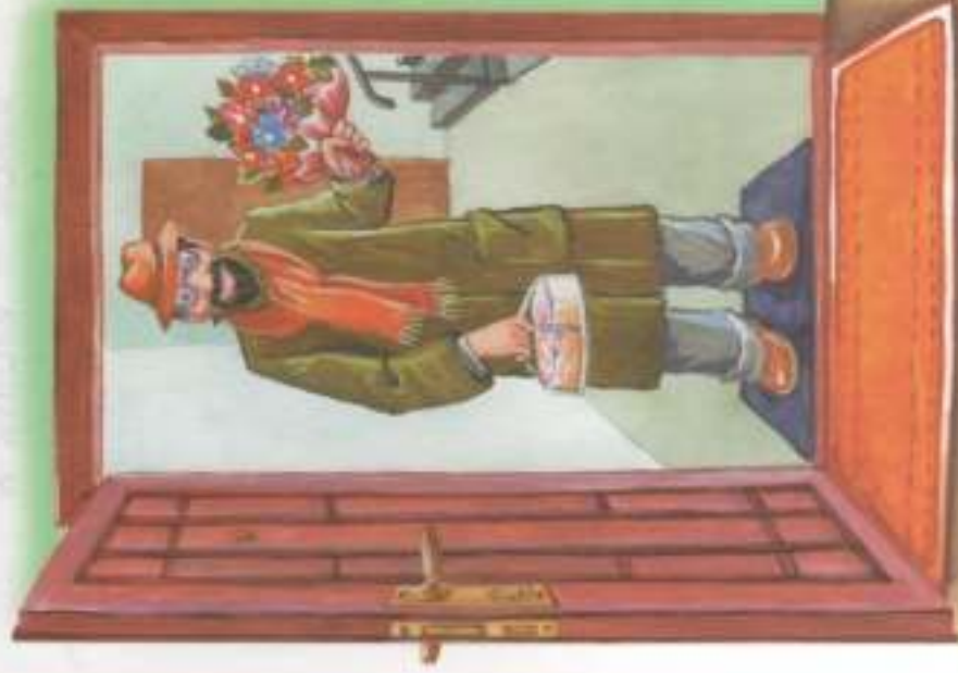
ЗА ДВЕРЬЮ — ГОСТЬ.