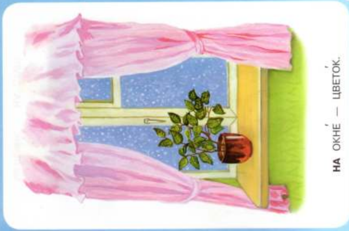
НА ОКНЕ — ЦВЕТОК.