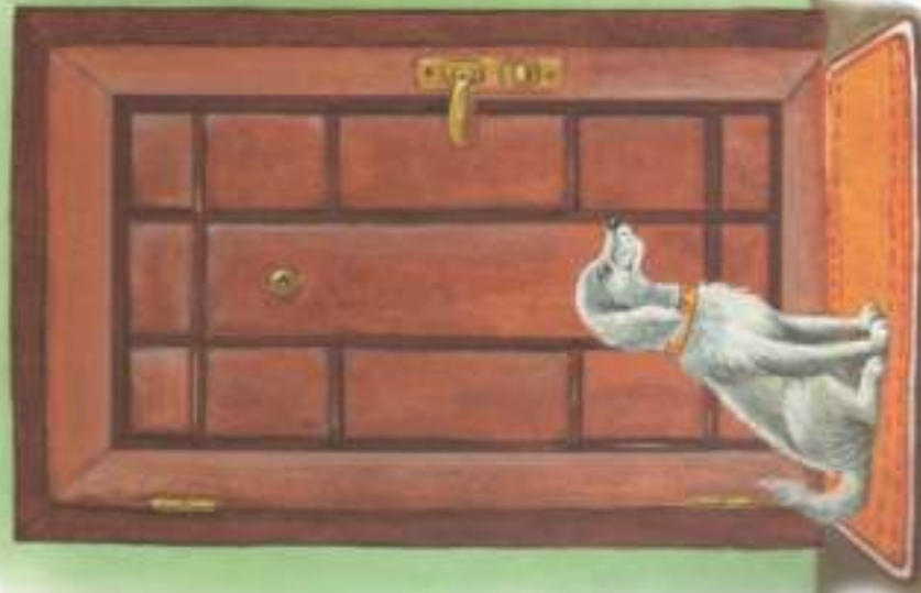
ПЕРЕД ДВЕРЬЮ — СОБАКА.