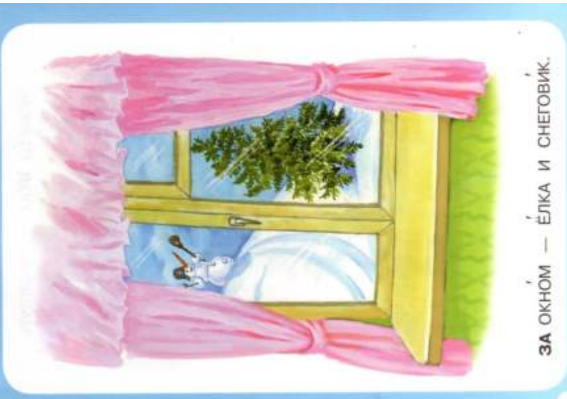
ЗА ОКНОМ — ЕЛКА И СНЕГОВИК.