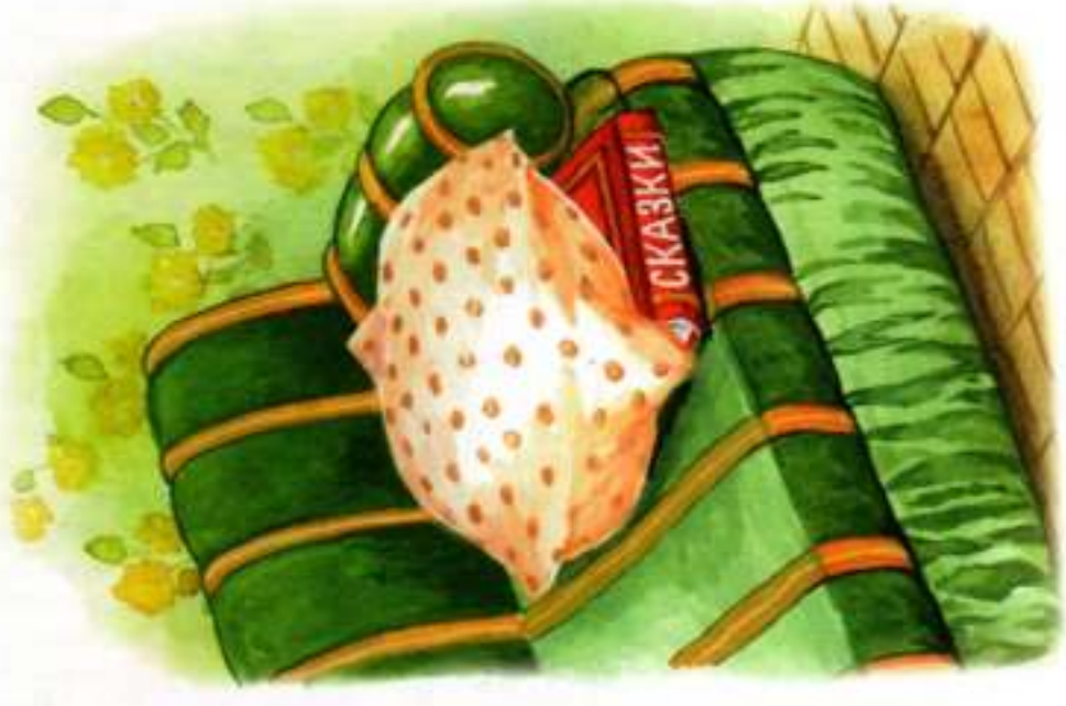
книга — под подушкой.