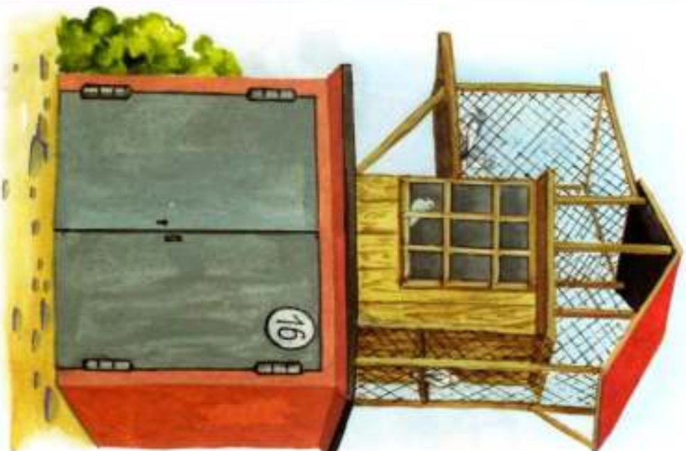
НАД ГАРАЖОМ — ГОЛУБЯТНЯ.