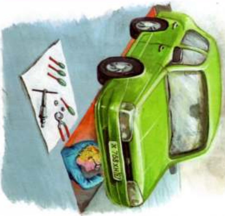
ПОД МАШИНОЙ — МЕХАНИК.