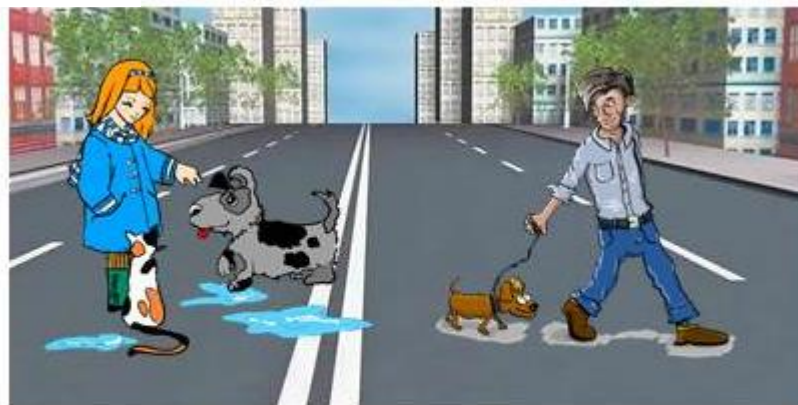
Для выгула домашних животных