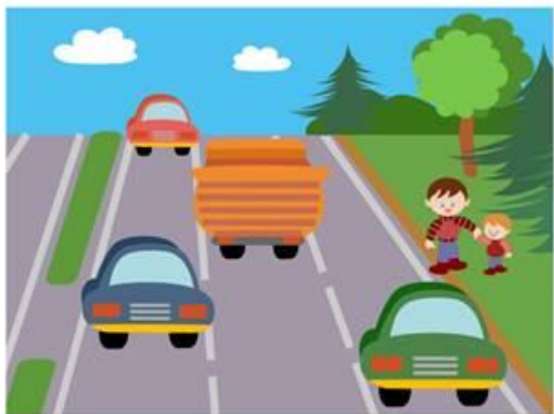
Для движения транспорта