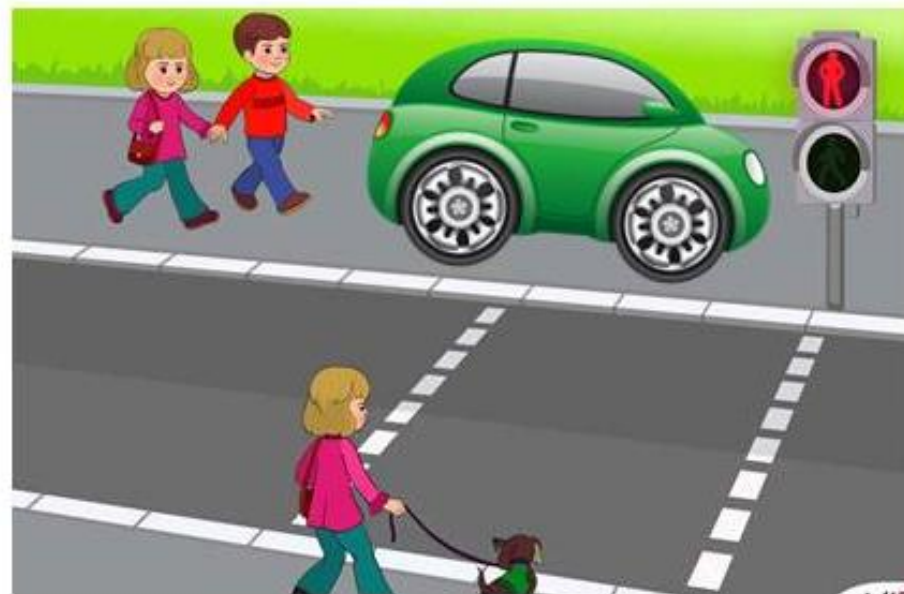
«Место стоянки машин»