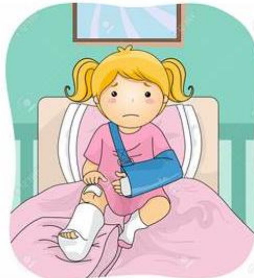
Попадешь в больницу