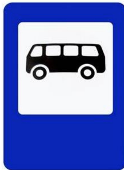
«Место остановки автобуса»