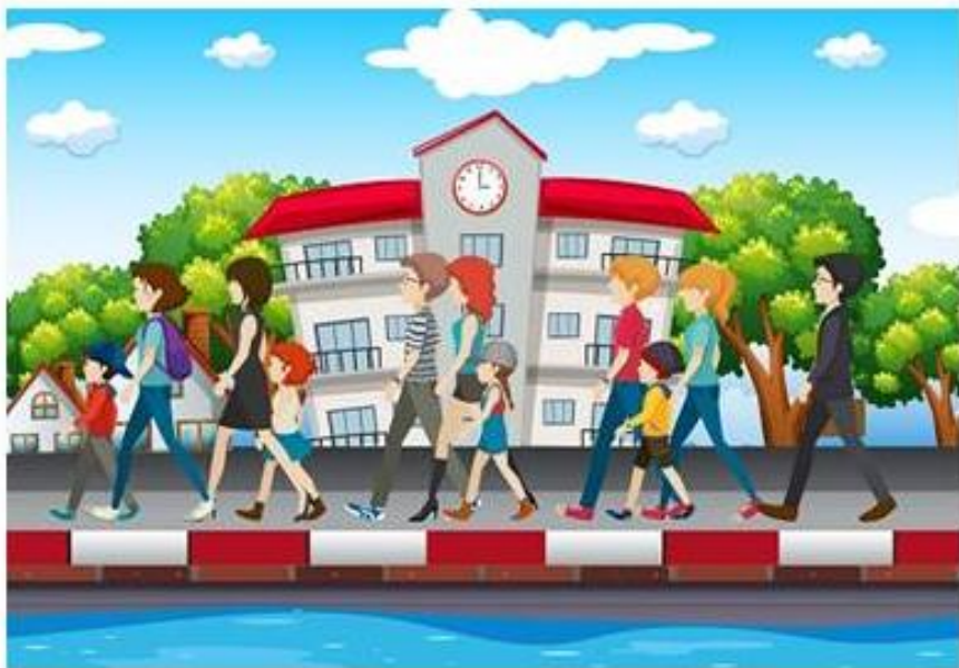
«Дорожка для пешеходов»