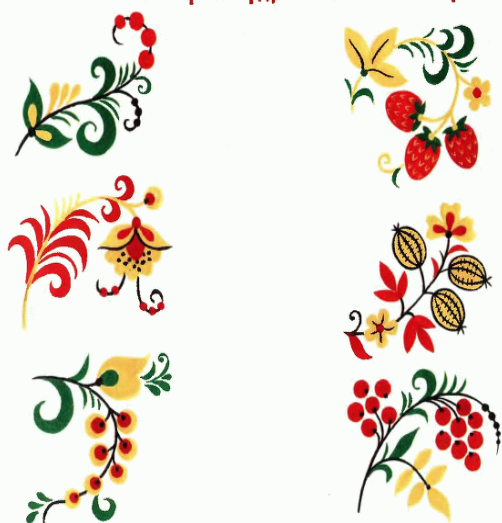
Рисүем күдрявые ветки и күстики