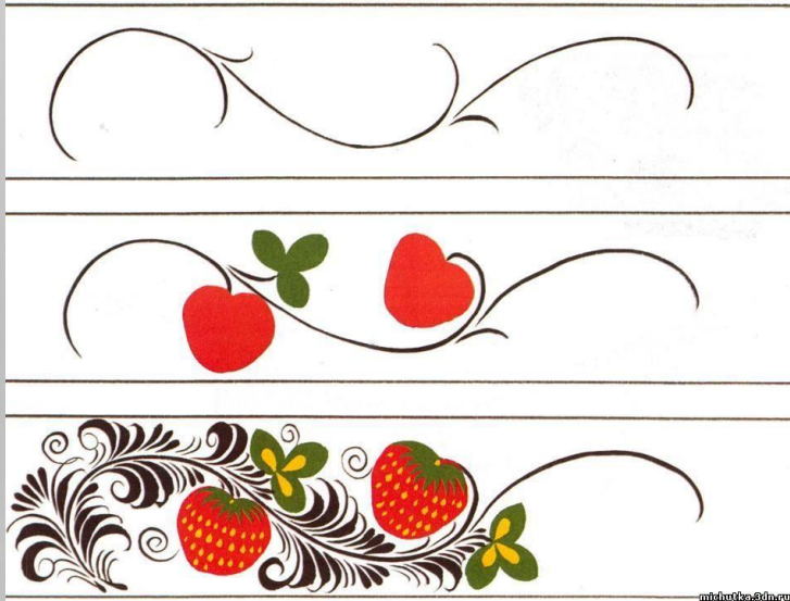
ОРНАМЕНТ С «ЯГОДКАМИ» И «ЛИСТОЧКАМИ»