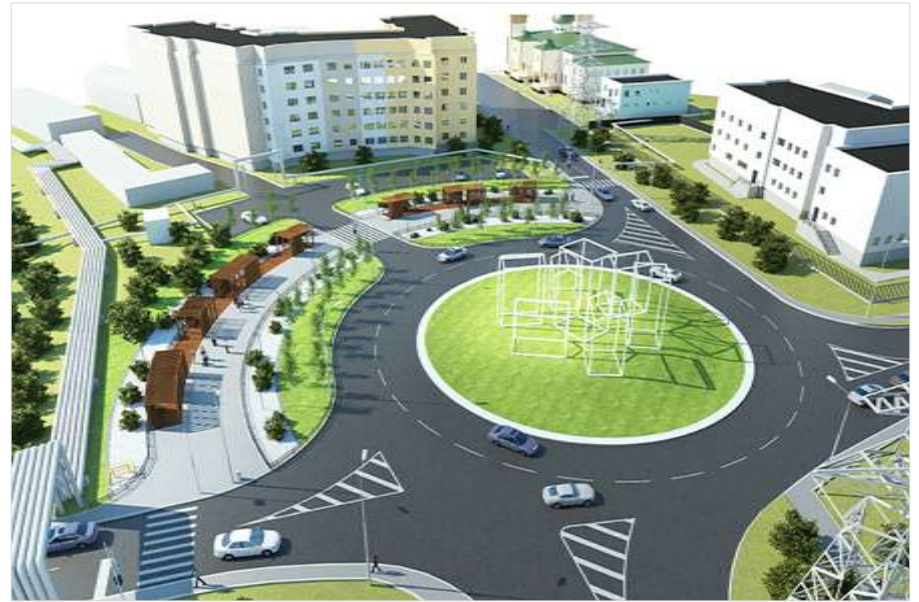
Создание городской среды