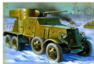
Картинки «Военная техника»