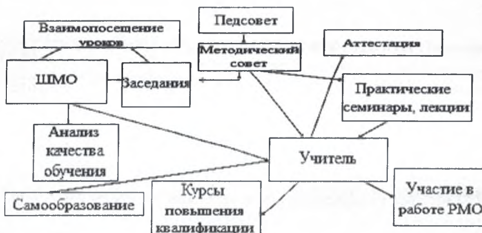
СХЕМА СТРУКТУРЫ МЕТОДИЧЕСКОЙ СЛУЖБЫ ШКОЛЫ

В школе сформирована система методической работы образовательной организации, где ключевыми структурными элементами являются педсовет, методический совет, школьные методические объединения учителей.