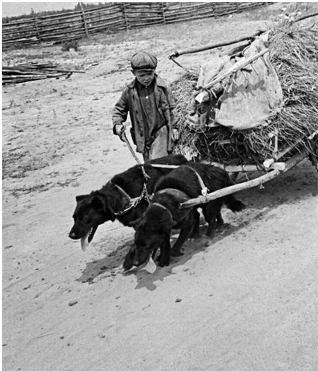
По дорогам войны