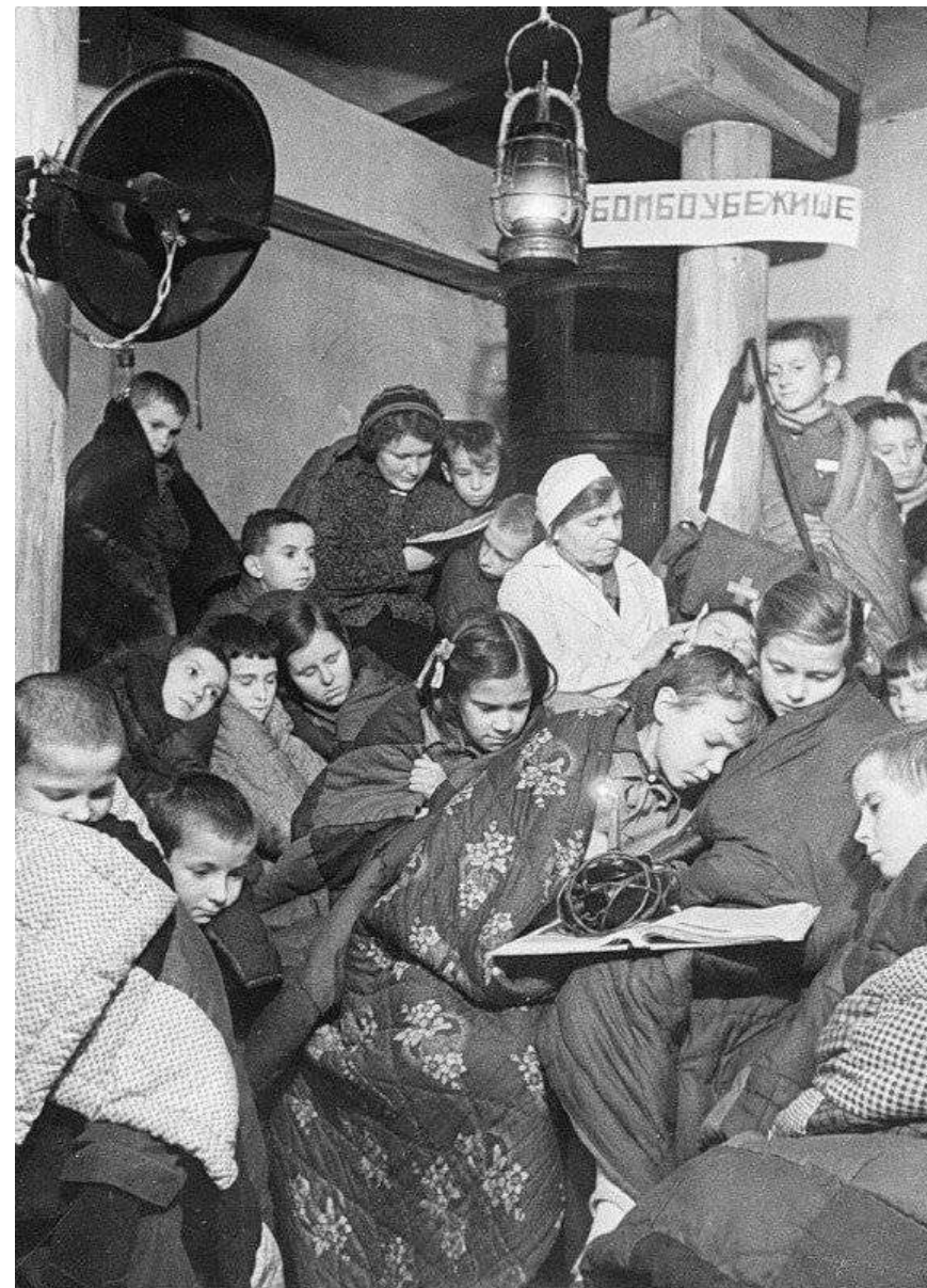
Бомбоубежище в Ленинграде