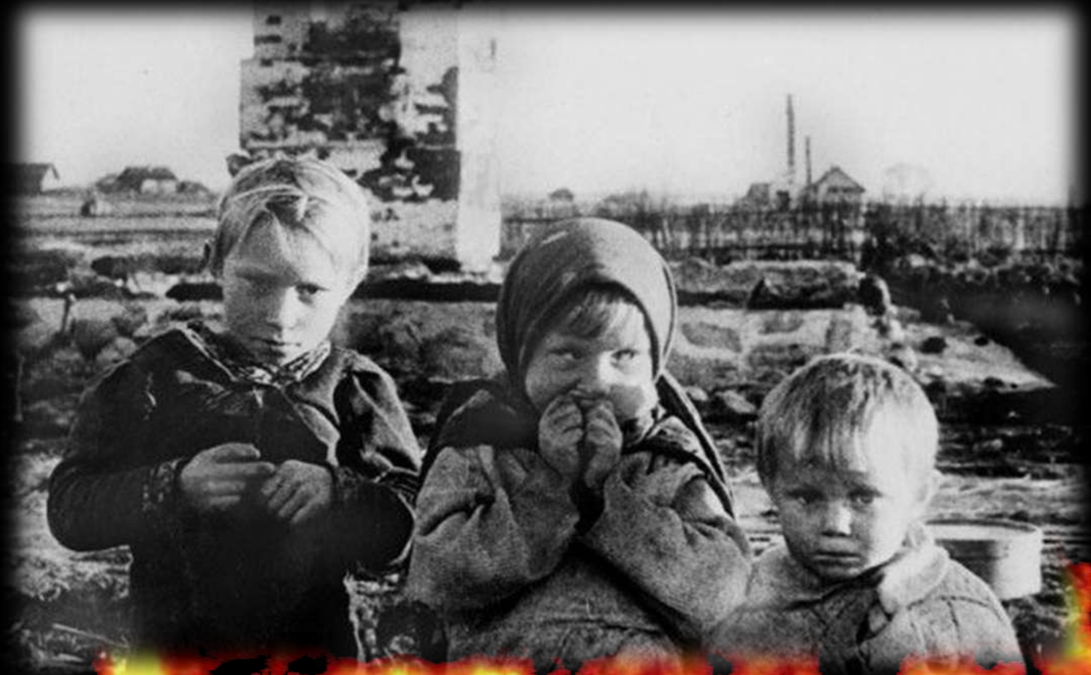
Белорусские дети войны. Деревня Лозоватка.