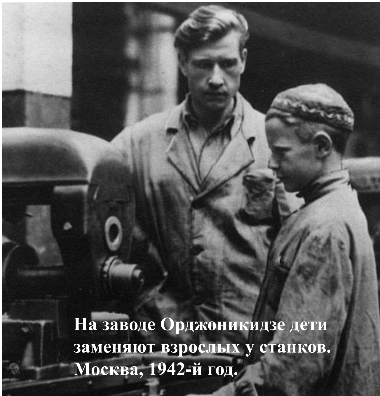
На заводе Орджоникидзе дети заменяют взрослых у станков. Москва, 1942-й год.