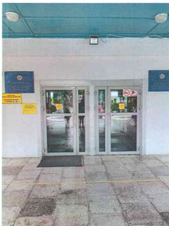
Фото №7 Ширина проема 90 см