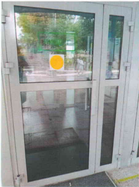
Фото №9 ширина проема 90 см