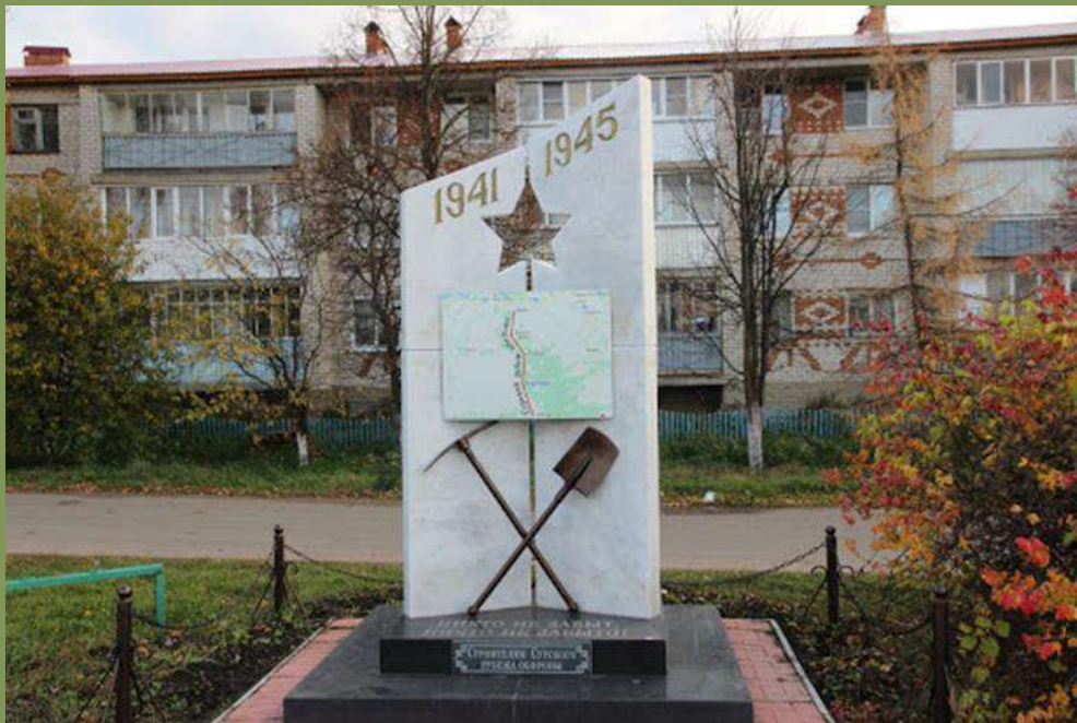
Памятник в с. Порецкое