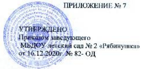
График отпусков работников МБДОУ детский сад № 2 «Рябинушка» на 2021г.

СОГЛАСОВАНО Первичной профсоюзной организацией МБДОУ детский сад №2 «Рябинушка» Протокол № 9 от 16.12.2020г.