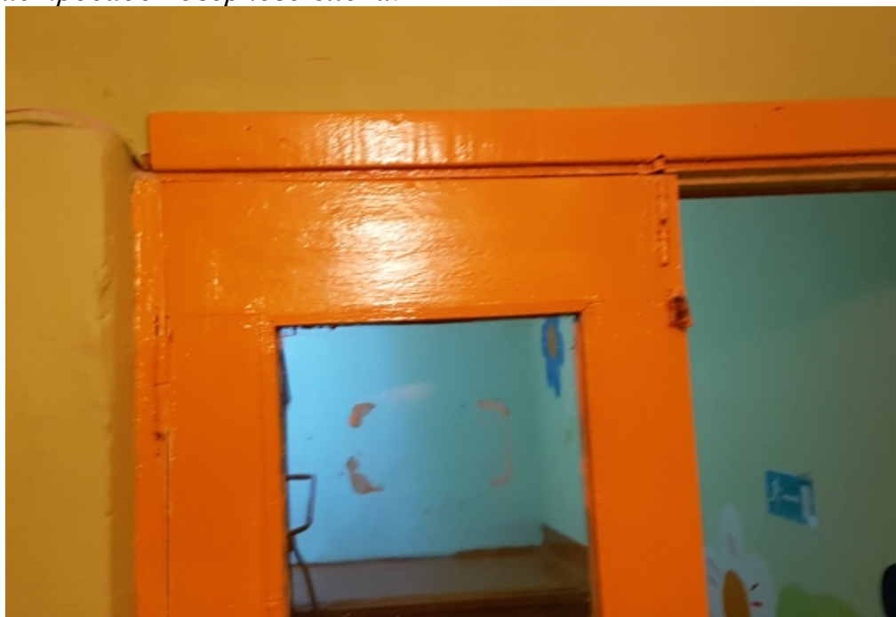
Фото №26 Коробление и наличие просадок дверного блока.