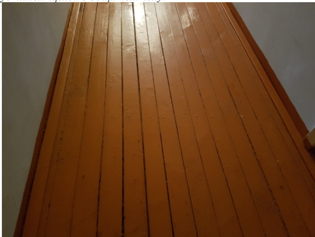
Фото №28 В полах имеются перепады и щели с раскрытием до 8мм