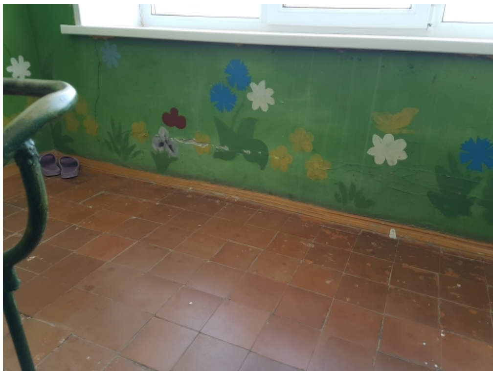
Фото №18 Разрушение лестничного марша пожарного выхода.