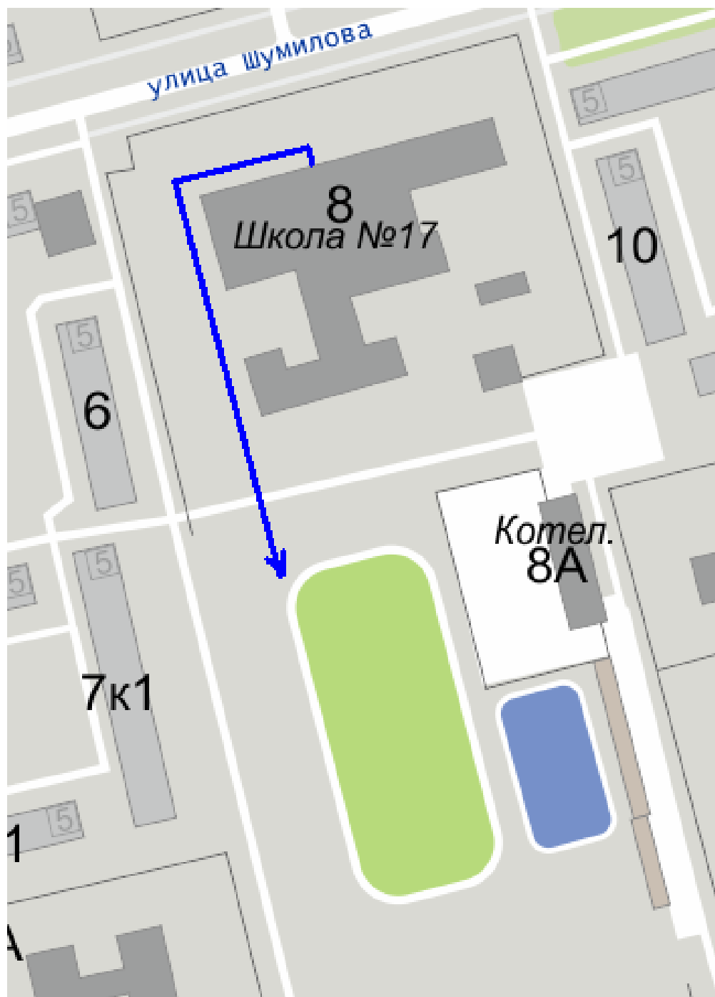
Схема №3 План-схема маршрута движения организованных групп детей от ОУ к стадиону