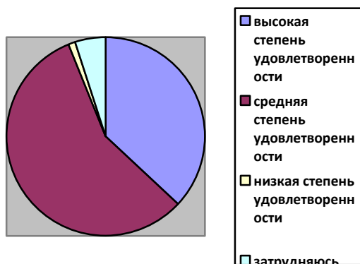
Рисунок 1 Удовлетворенность родителями качеством образования